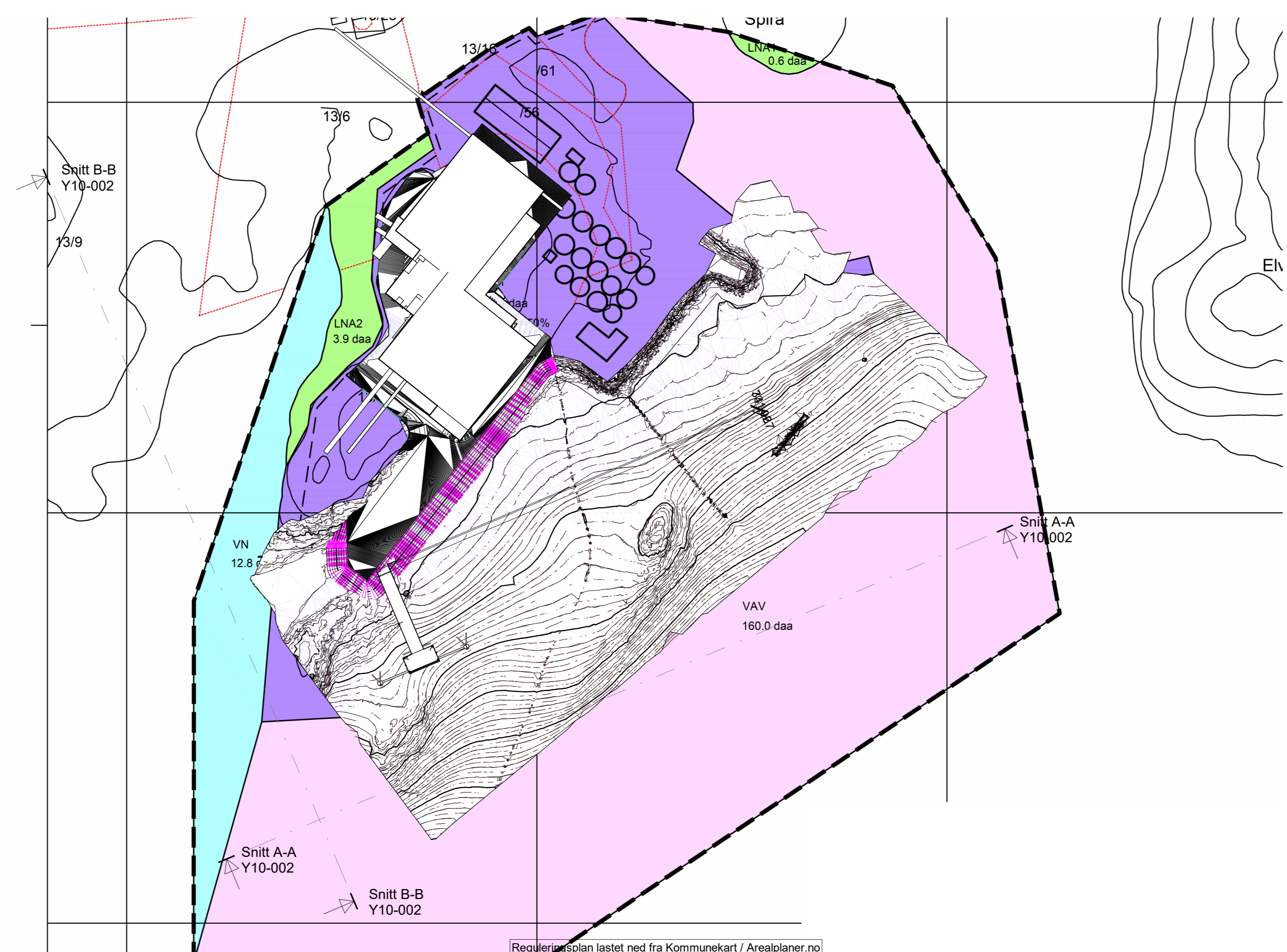
Oversikt snitt 1: 2000