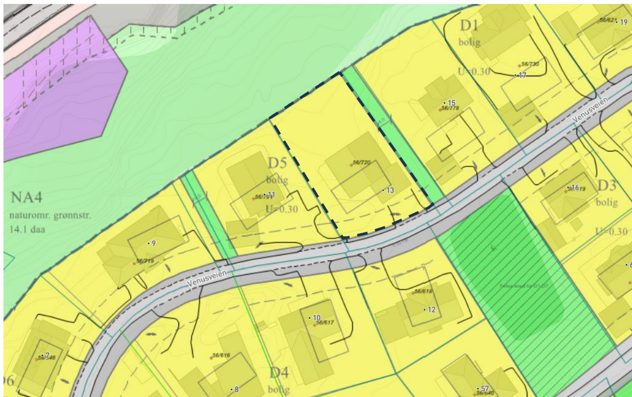
Figur 4. Utsnitt fra gjeldendereguleringsplan, PID 261. Markert område med stiplet svart linje angir tiltaksområdet.