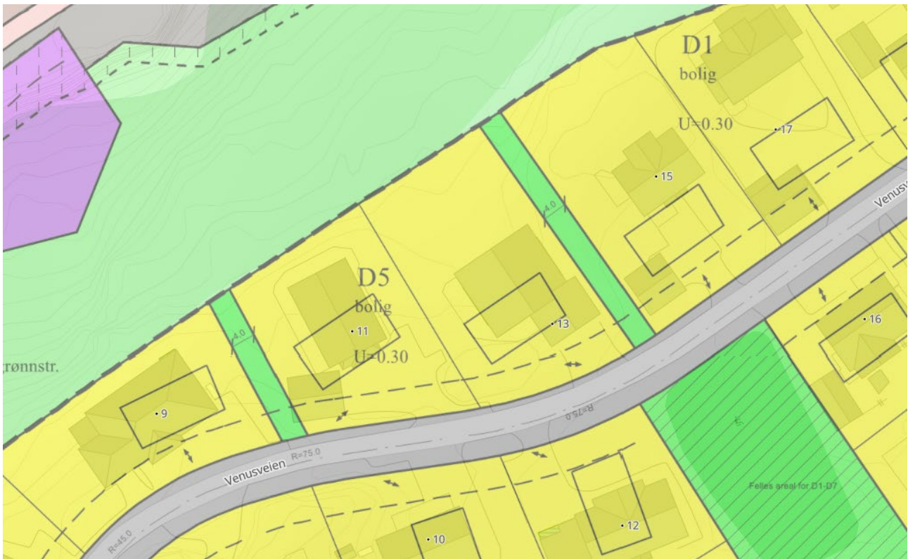
Figur 5. Utsnitt fra gjeldende plankart. Tomten er en av to tomter innenfor D5.