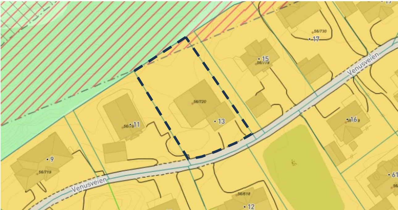
Figur 3. Gjeldende KPA for Harstad kommune, PID 605. Stiplet linje angir tiltaksområdet for ønsket endring.

Tiltaksområdet er i KPA avsatt til BA6, bebyggelse og anlegg. En mindre del av tiltaksområdet er underlagt faresone for ras- og skredfare, med hensynsnavn 310-1. I disse områdene tillates ikke etablering av ny bebyggelse med mindre det foreligger en fagkyndig utredning og dokumentasjon som konkluderer med at området er av tilstrekkelig sikkerhet mot skred.