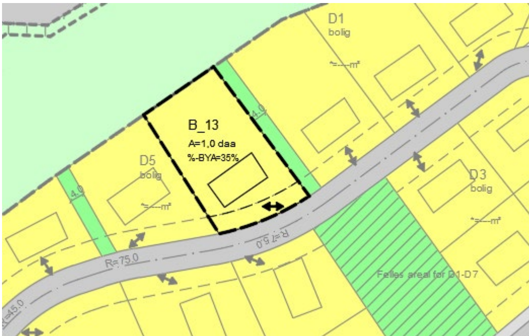
Figur 6. Utsnitt av forslag til reguleringsendring i området angitt med svart stiplet linje, sett sammen med gjeldende plan.